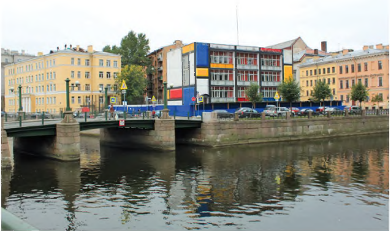
Рис. 2. Наб. р. Мойки (2013 г.). Участок исследования. Вид с северо-востока