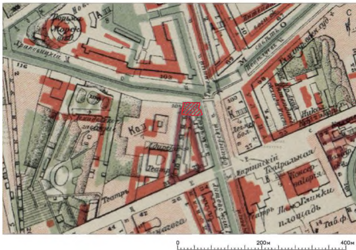
Рис. 4. План Санкт-Петербурга. 1904 г. Фрагмент. Исследуемый участок указан красной штриховкой

В четырех траншеях, прорытых на территории планируемого строительства, прослежена стратиграфия городских культурных напластований XVIII–XX вв. Период, связанный со строительством тюремного замка по проекту И. Е. Старова в 1783–1787 гг. и дальнейшими его перестройками в XIX в., отмечен в траншеях 1 и 2, где найдены остатки каменной и бутовой кладки восточного корпуса Литовского замка и подстилающие их слои XVIII в. К остаткам разрушения Литовского замка следует относить слой кирпичного боя, которым в траншее 2 перекрыты остатки стен (рис. 6; 7). Обнаруженные остатки архитектурных сооружений требуют дальнейшего изучения.