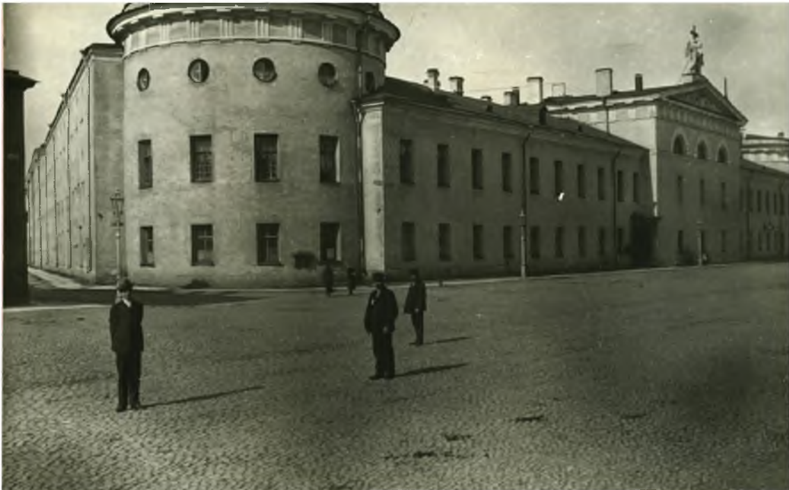
Рис. 3. Литовский замок. 1900-е гг. Фотография Н. Г. Матвеева. Фотоархив ИИМК РАН